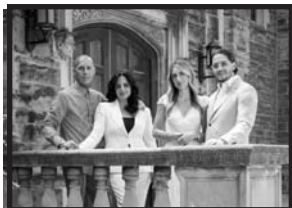
The Vescio Family