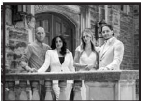
The Vescio Family