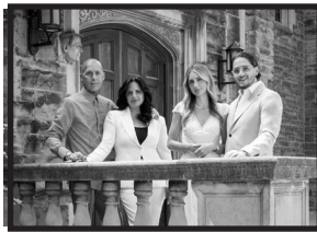
The Vescio Family

Remember... Let our advertisers know you saw their ad here.