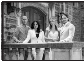
The Vescio Family