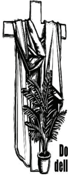
Domenica delle Palme