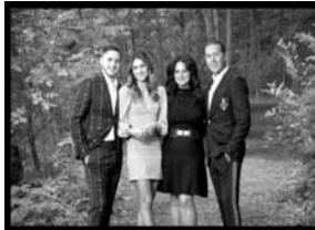
The Vescio Family