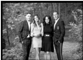
The Vescio Family