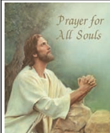
Prayer for All Souls

For the full message please visit: www.vatican.va